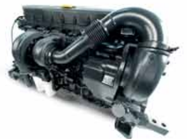
FPT Cursor motor ile maksimum güç, minimum yakıt tüketimi