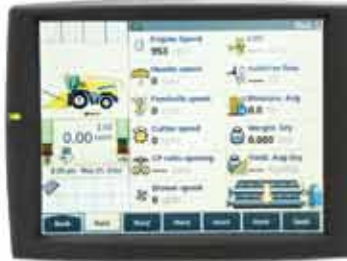
IntelliView IV™ renkli, dokunmatik montiör