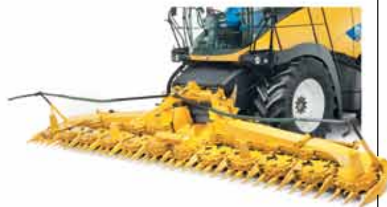
6, 8, 10 ve 12 sıralı, sıra bağımsız mısır tablaları