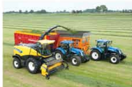
6,4 metre yüksekliğe sahip boşaltma tüpü sayesinde yüksek römorklar ile çalışabilme