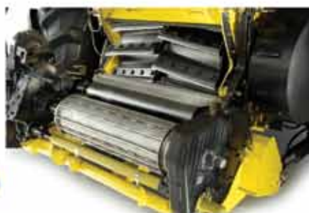
860 mm genişliğindeki besleme ağızı ile verimli besleme