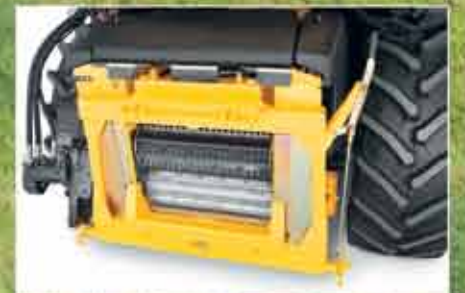
HydroLoc™ tahrik sistemi ile sınırsız kıyma boyu