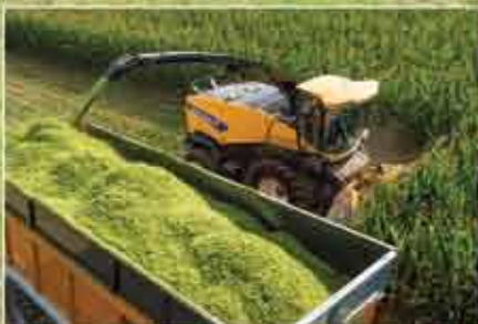
1.220 Litre kapasiteye sahip yakıt tankı