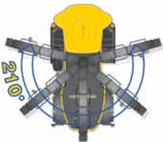
210° dönme açısına sahip boşaltma tüpü