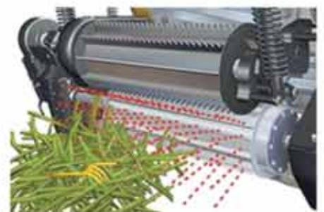
Standart MetaLoc™ metal tarama sistemi ve monitörden metal yerinin tesbiti