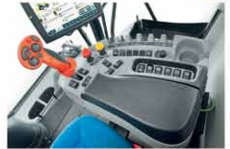
Koltuğa monte konsol ile rahat ve güvenli çalışma