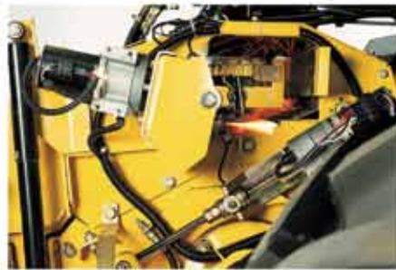
Standart, kabinden kontrol edilebilen otomatik bıçak bileme sistemi