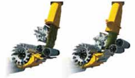
Variflow™ sistemi ile 40 HP daha az güç tüketimi