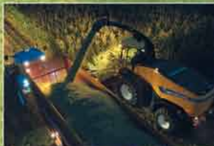
Standart halojen lambalar sayesinde kesintisiz çalışma