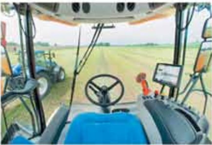
325° görüş açısına sahip geniş ve konforlu kabin