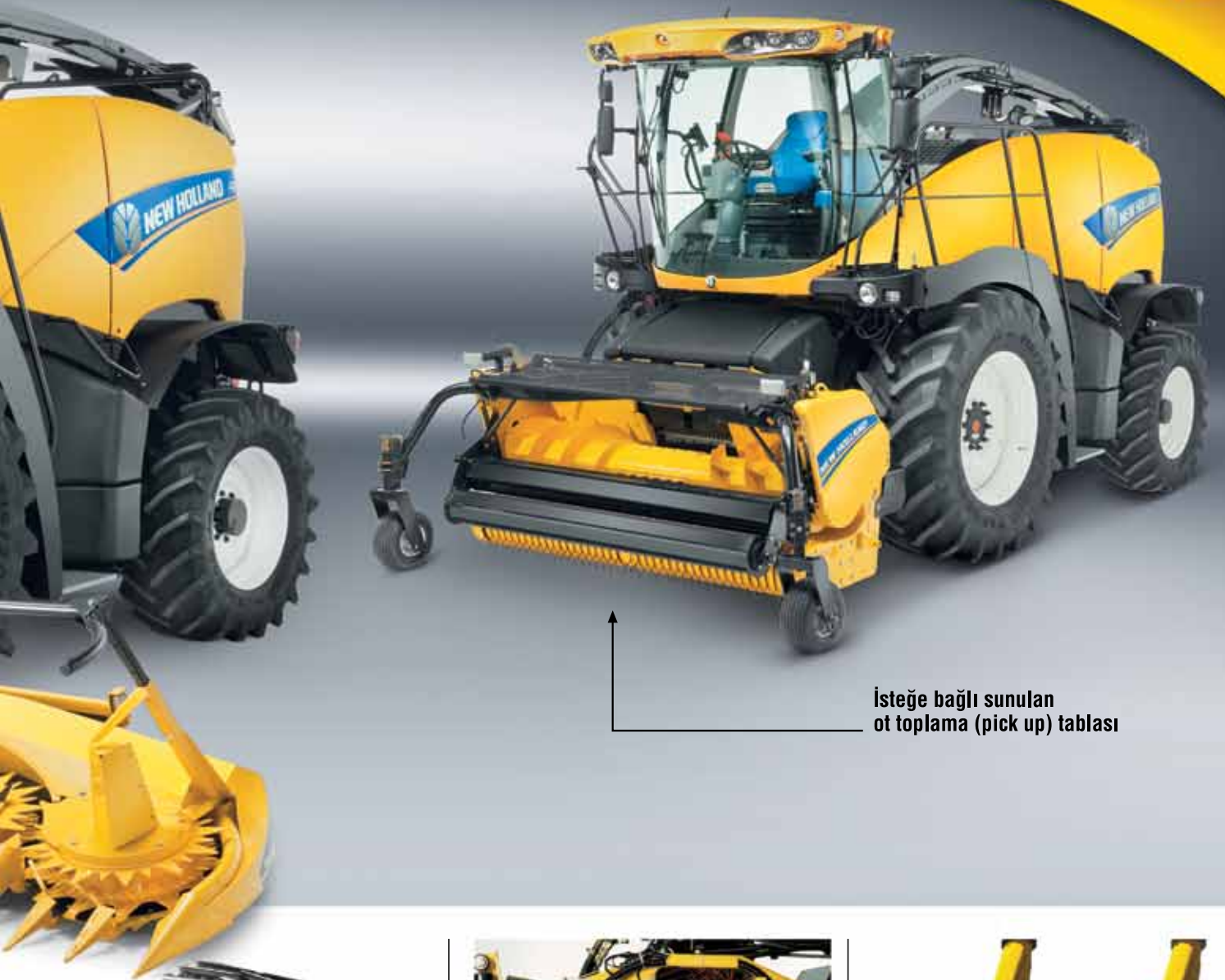
İsteğe bağlı sunulan ot toplama (pick up) tablası