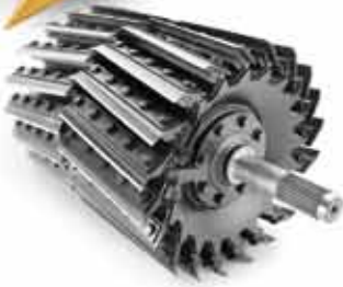
710 mm çapa sahip kesme tamburu ile etkin kıyma